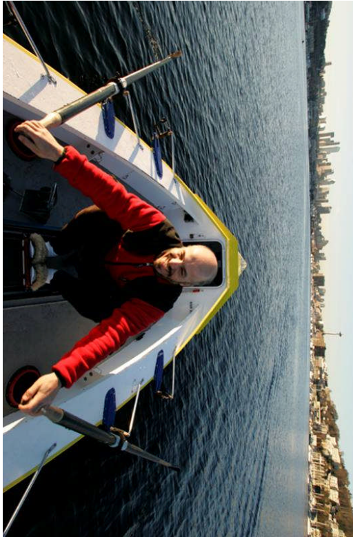
Okyanustarda kullanılacak teknikle Seattle'da