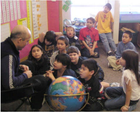
British Columbia'da Fort Nelson yerli köyünün Chalo ilkokulu öğrencileriyle