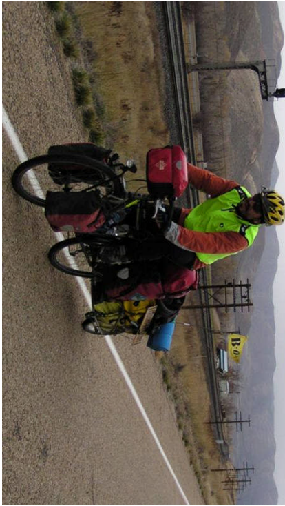
23 Ekim 2004 tarihinde Salt Lake City'den ayrılırken

Around-n-Over P.O. Box 19662 Seattle, WA 98109-6662